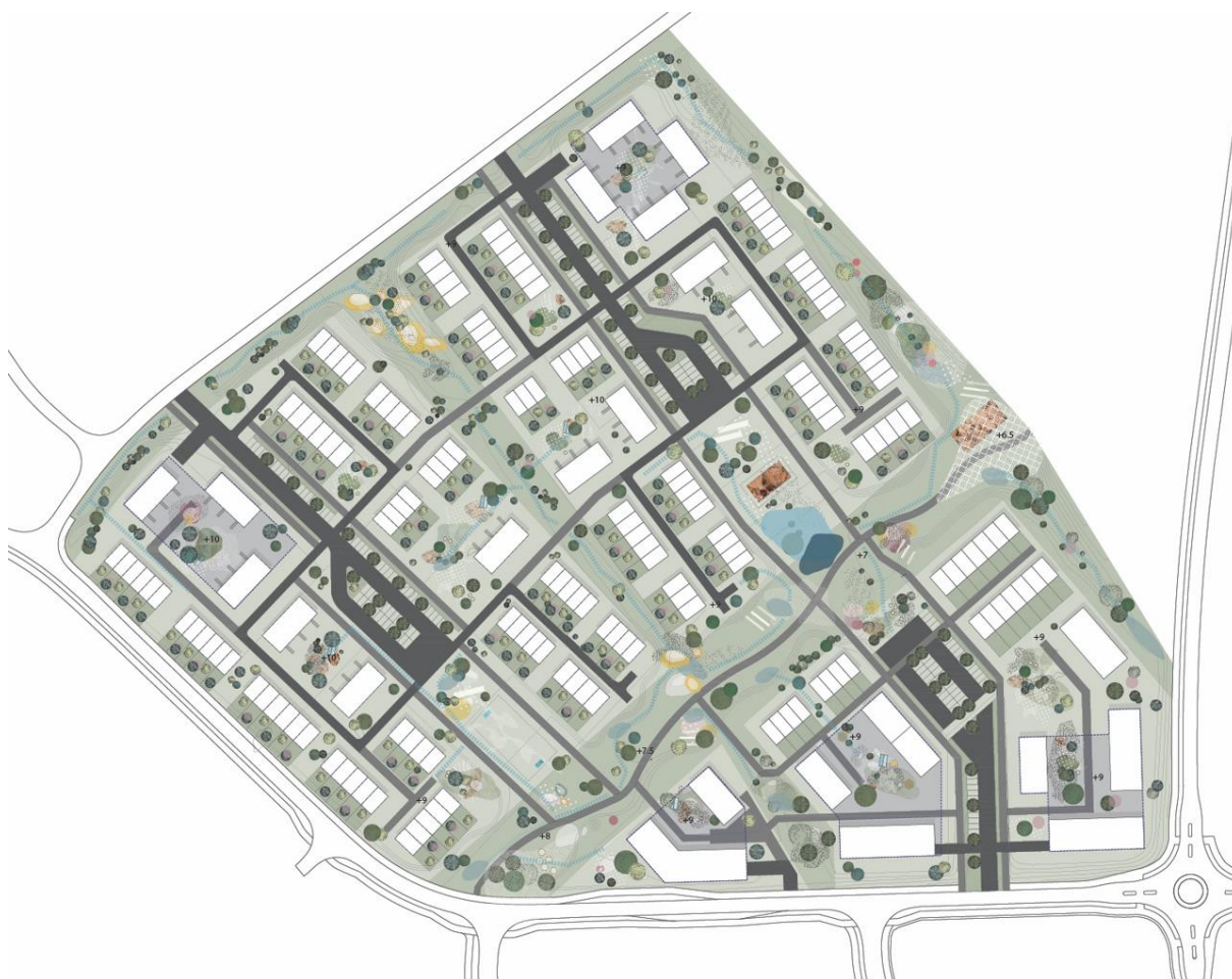
Bilde 1: Utsnitt av situasjonsplan for Gimsøya med de ulike feltene.

Området ligger i Melhus kommune, ca. 1 km fra sentrum i et område som heter Gimsøya. Området er en del av områdereguleringen for Melhus sentrum som ble vedtatt i 2019, og med en reguleringsendring vedtatt desember 2021 som følge av en påkrevd sikkerhetsavstand til Metro vannledning. Videre ble det tatt inn ny avløpsledning for overvann i Gaula og justering av feltene B4-8.